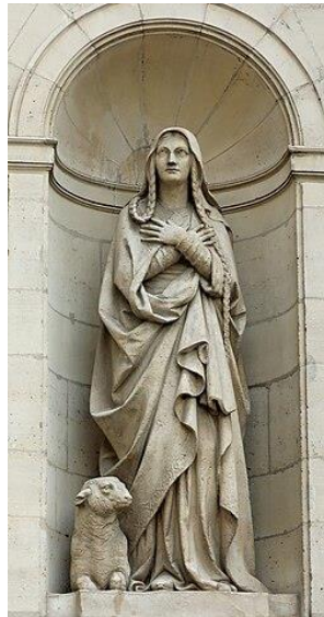
Sainte Geneviève Le 3 janvier

Sainte Geneviève, qui est fêtée le 3 janvier, est une sainte gallo-romaine, patronne de la ville de Paris et des gendarmes. Elle est née à Nanterre vers 420 et décédée à Paris. Baptisée, elle se voua très jeune à Dieu. Elle a mené une vie consacrée et ascétique (ensemble d'exercices spirituels), probablement dès ses seize ans. A l'âge de 18 ou 20 ans, elle reçoit à Paris le voile des vierges des mains de l'évêque Willicus. À la mort de ses parents vers 440, elle quitte Nanterre et vient s'établir chez sa marraine en plein Paris, dans l'île de la Cité.