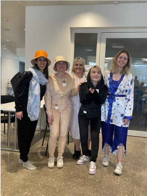
Souvenir du défilé de mode de la Boutique Toi & Moi. Merci aux mannequins et aux spectateurs !