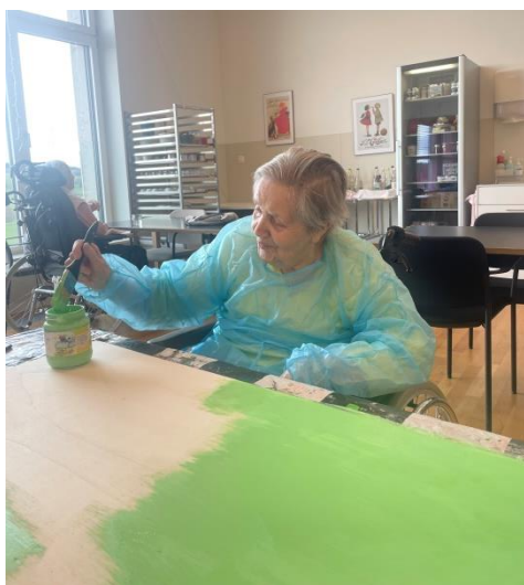
Merci pour leur précieuse aide pour la confection des décorations de printemps.