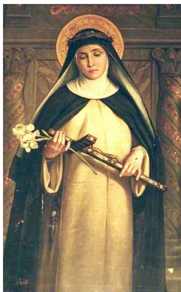
Sainte Catherine de Sienne Le 29 avril

Sainte Catherine de Sienne, née en 1347 à Sienne en Italie, est l'une des grandes saintes de l'Église. Très jeune, elle montre un grand amour pour Dieu et choisit de Lui consacrer sa vie. À seize ans, elle entre dans le Tiers Ordre dominicain et commence une vie simple, faite de prière, de service et d'aide aux pauvres et aux malades.