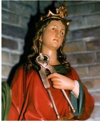
Sainte Apolline Le 9 février

Apolline présente l'intérêt de dériver de "Apollon", ce qui fait référence à la beauté.