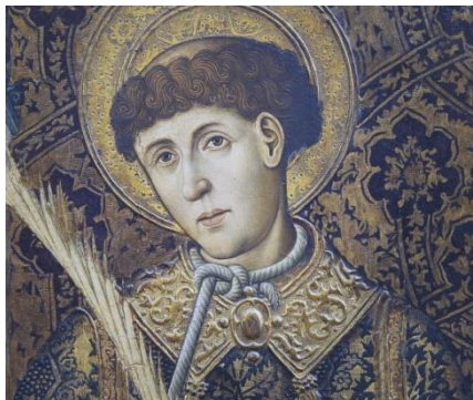
Saint Vincent de Saragosse Le 22 janvier

Vincent de Saragosse est un diacre espagnol au temps de l'évêque Valère (290-315), mort martyr en 304 à Valence lors de la persécution de Dioclétien. Reconnu saint, il est commémoré le 22 janvier selon le Martyrologe romain par les catholiques et le 11 novembre par les orthodoxes.