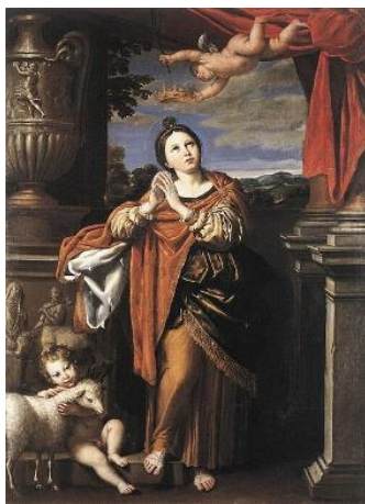
Sainte Agnès Le 21 janvier

Agnès de Rome ou sainte Agnès (née vers 291 et morte en 304 ou 305) est une vierge, sainte et martyre, fêtée le 21 janvier selon le Martyrologe romain en tant que martyre de la pureté.